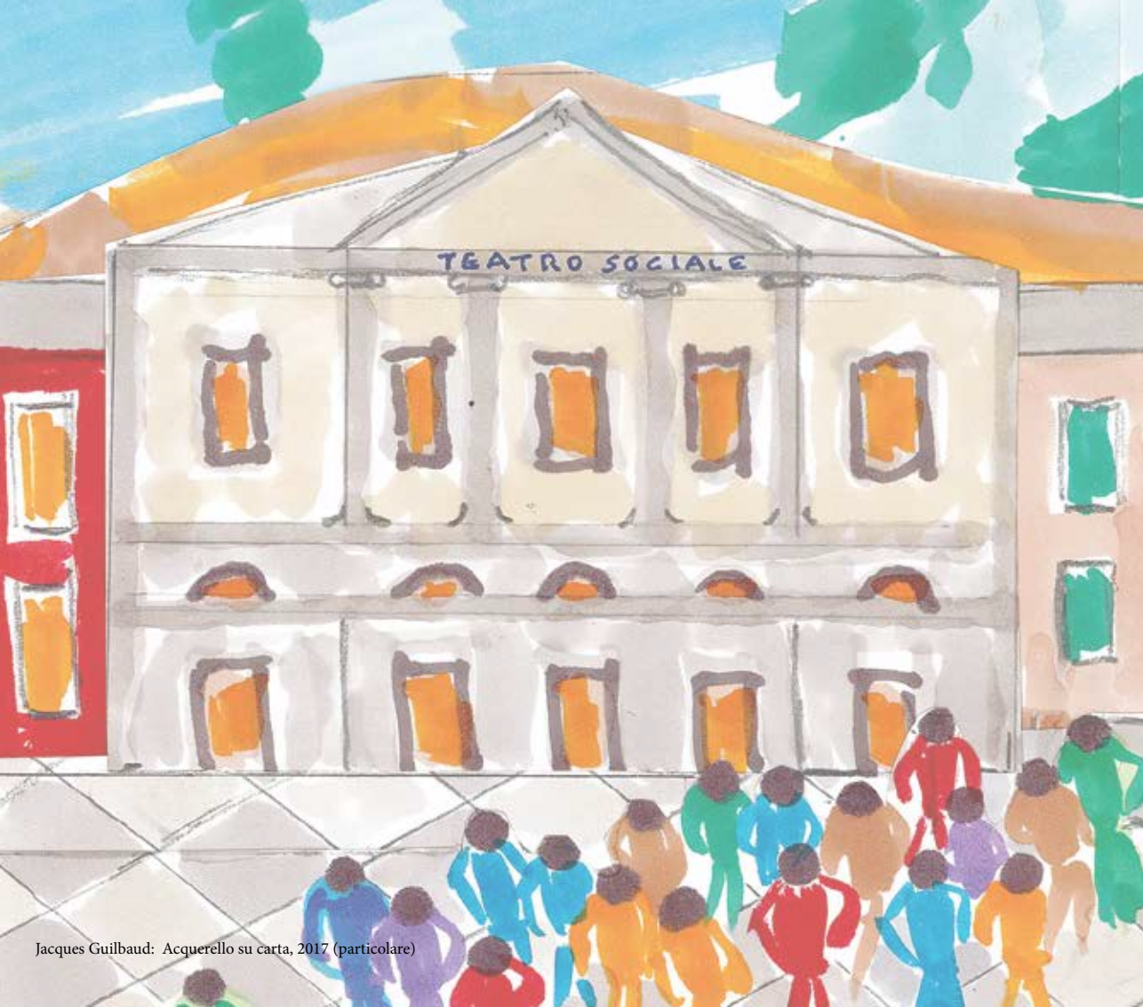
Jacques Guilbaud: Acquerello su carta, 2017 (particolare)